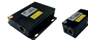
IP 2 WIRES CONVERTER Permet le raccordement d'un équipement IP distant sur 2 fils. Composé d'1 module "récepteur" installé en amont et connecté au switch et d'1 module "transmetteur" installé en aval et connecté à l'équipement IP distant. REF 310.5000-1