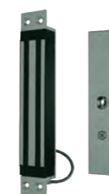
VENTOUSE ENCASTRE 300KG 24V Ventouse en encastré conforme NFS61937 REF 320.1200