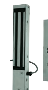
VENTOUSE APPLIQUE 300KG 24V Ventouse en applique conforme NFS61937 REF 320.1300