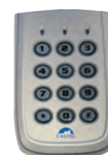
CLAVIER AUTONOME AV Clavier à code autonome en Zamak (IP65 - IK10) avec 2 relais - 1 buzzer REF 330.0050